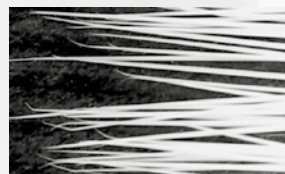
Fibres synthétiques ordinaires

Bien que les pointes des fibres Aqua Blue soient extrêmement fines, elles offrent une grande stabilité.